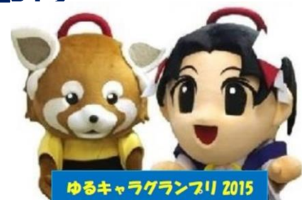
ゆるキャラグランプリ 2015