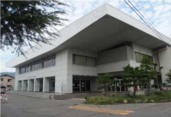
解体前の篠ノ井市民会館