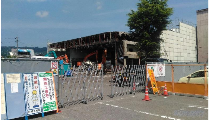
解体工事の様子(7月初旬)