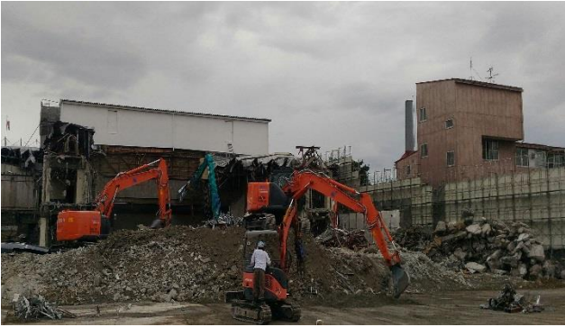
解体工事の様子(7月下旬)